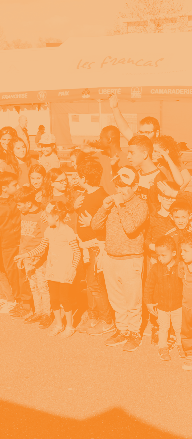
Photographies Francas 54